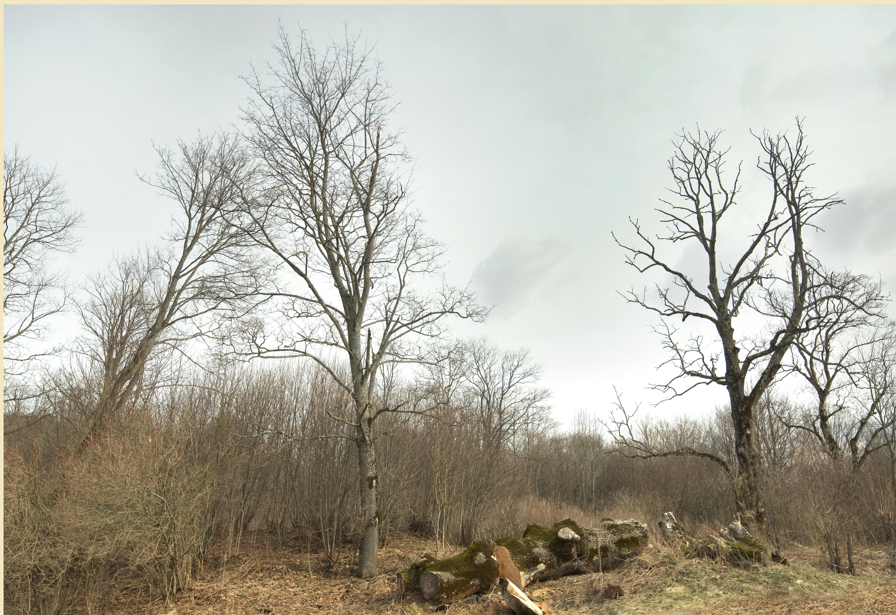
Miejsce po Szumnym Dworze