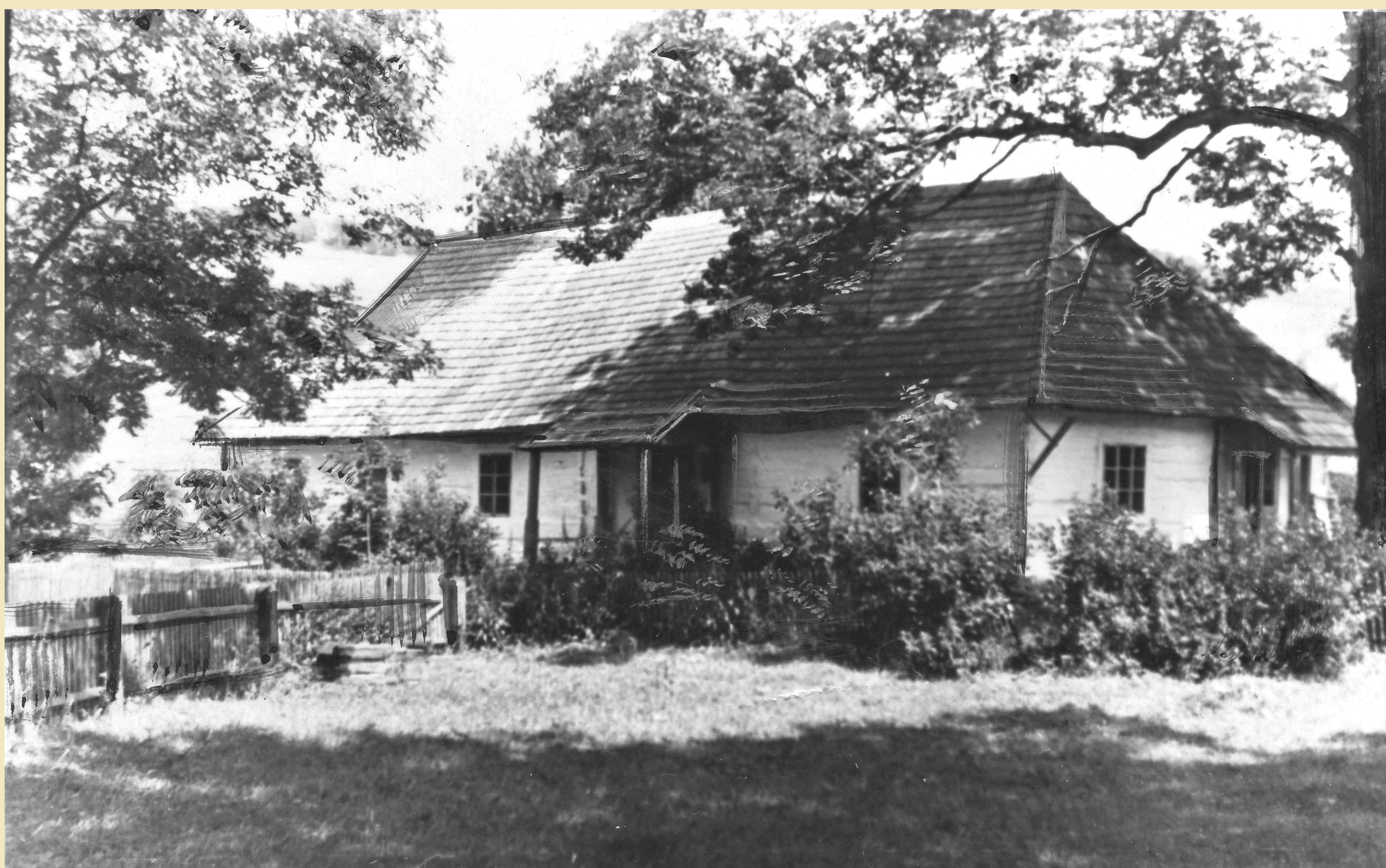
Szumny Dwór w Kalnicy