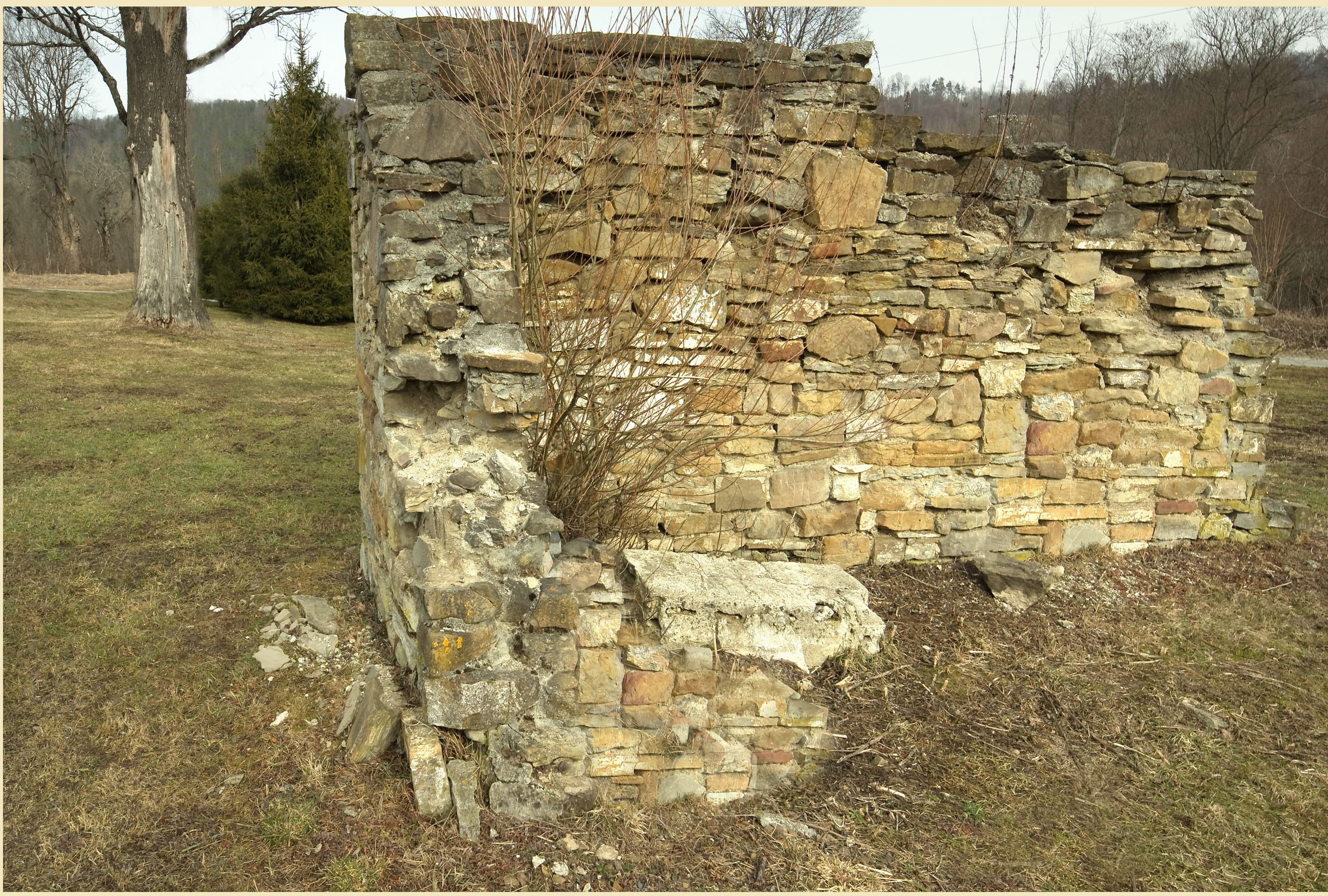
Ruiny zabudowań gospodarczych