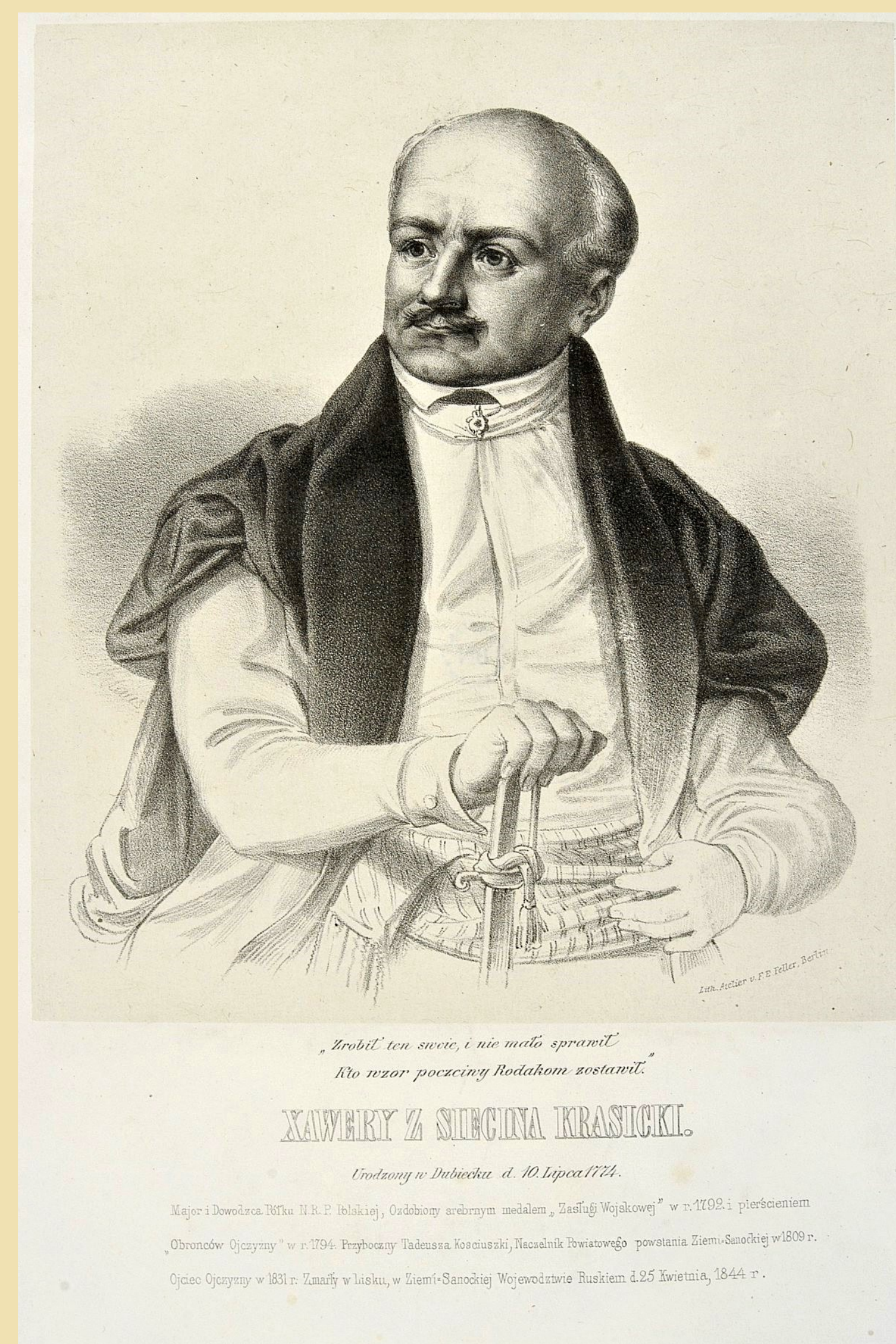
1832 - poznałem starego Ksawerego Krasickiego, który się odtąd stał dobrodziejem moim...