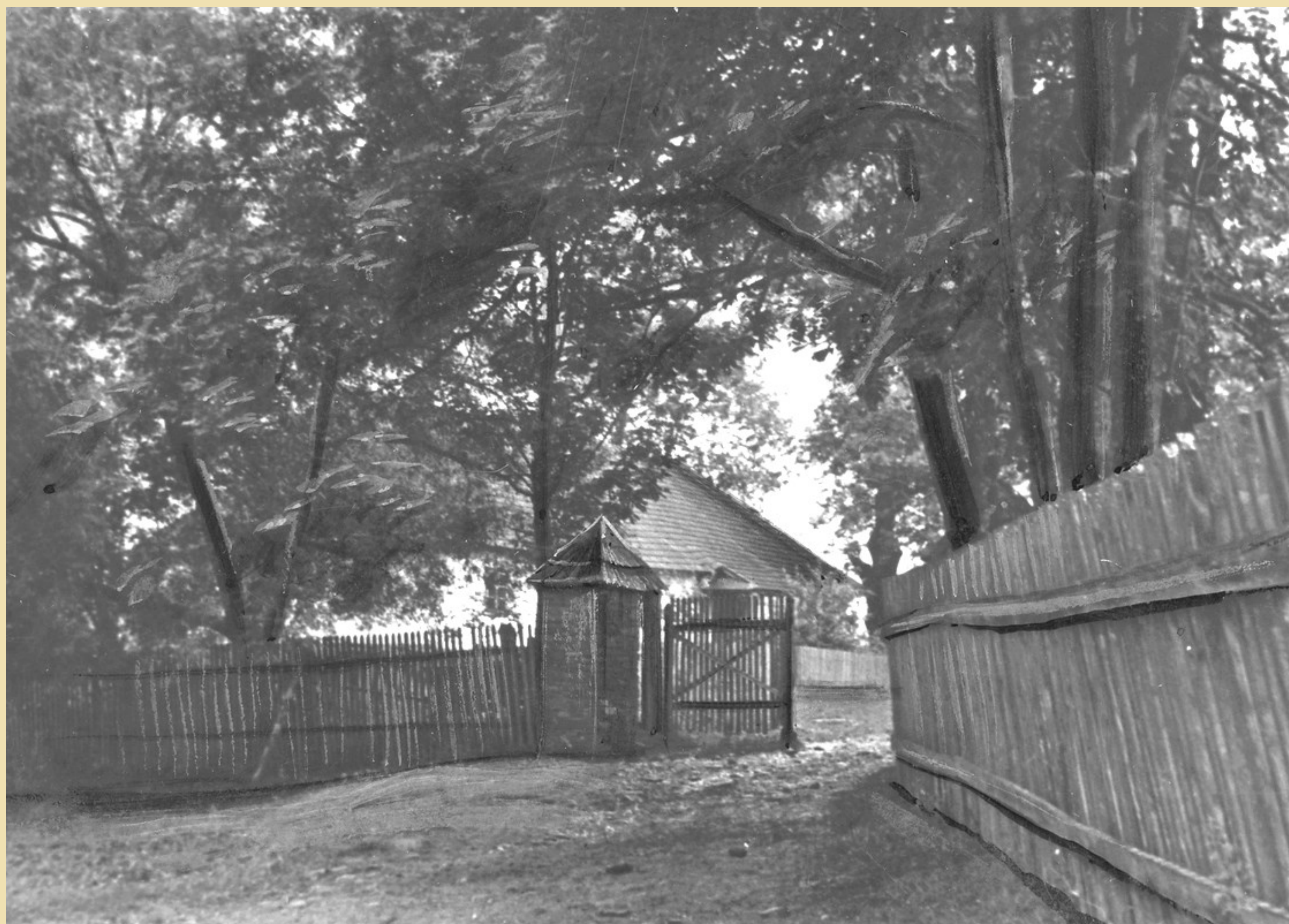
Dwór w Kalnicy - widok bramy wjazdowej