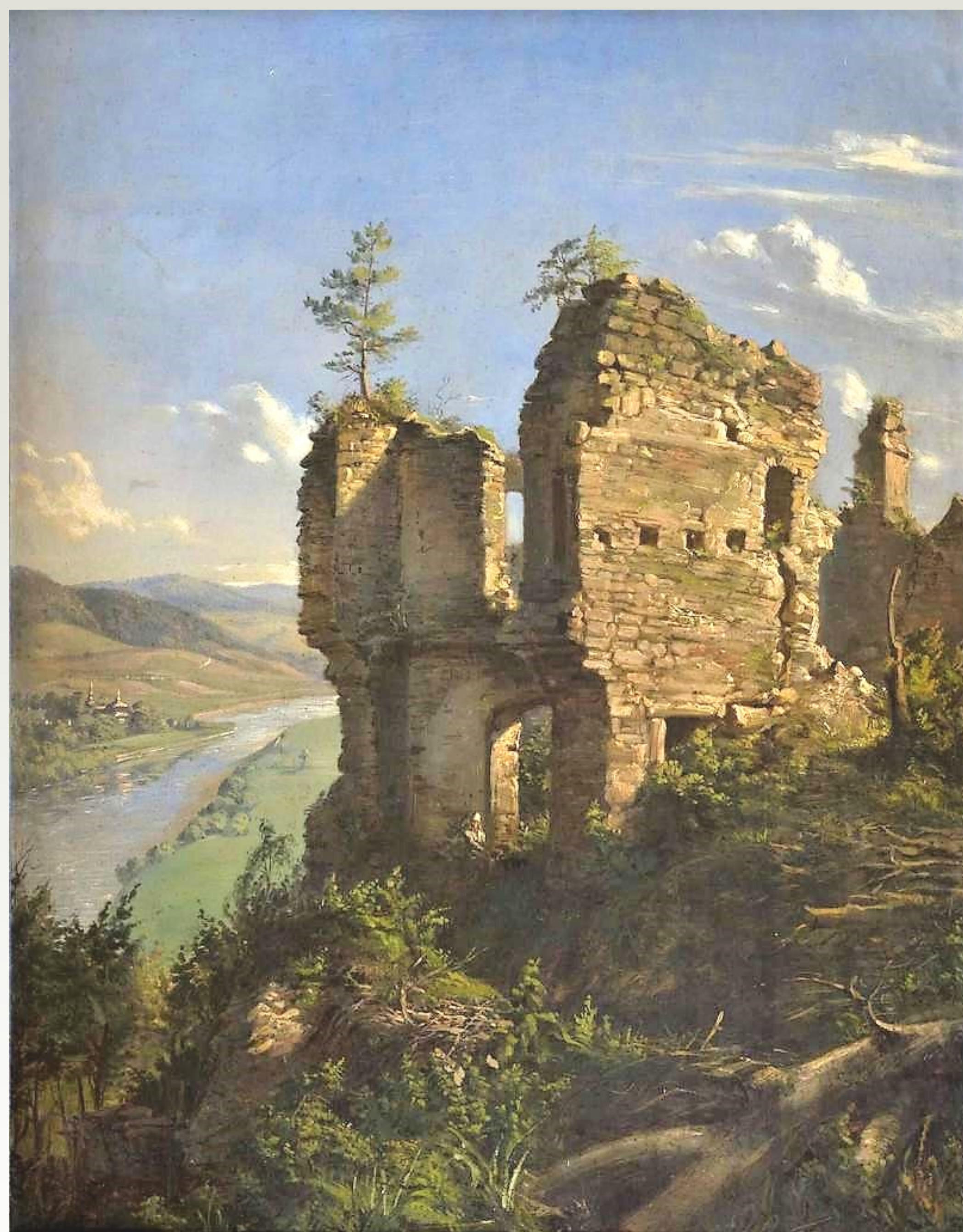
RUINY ZAMKU W SOBIENIU, ANDRZEJ GRABOWSKI, 1859