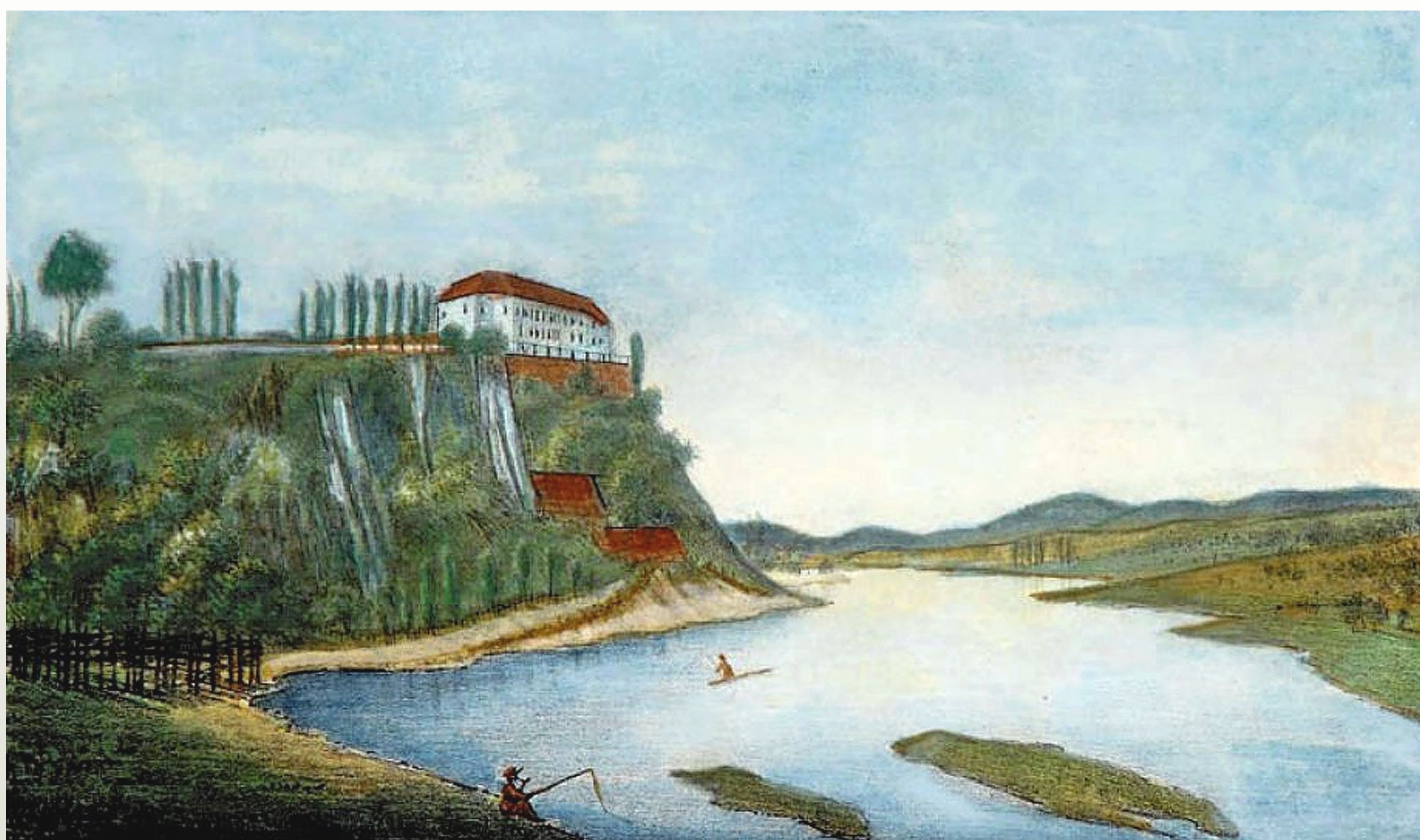
ZAMEK W SANOKU NAD SANEM OD POŁUDNIA, MACIEJ BOGUSZ STĘCZYŃSKI, 1846