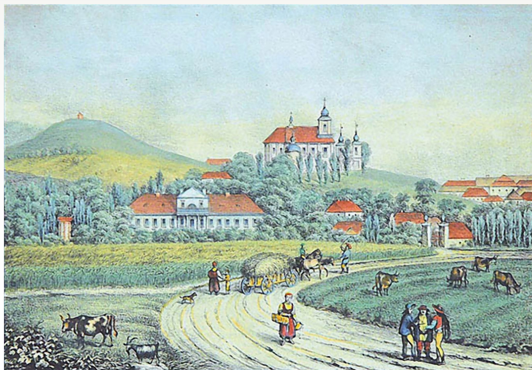
WIDOK RYMANOWA, KAROL AUER, 1837