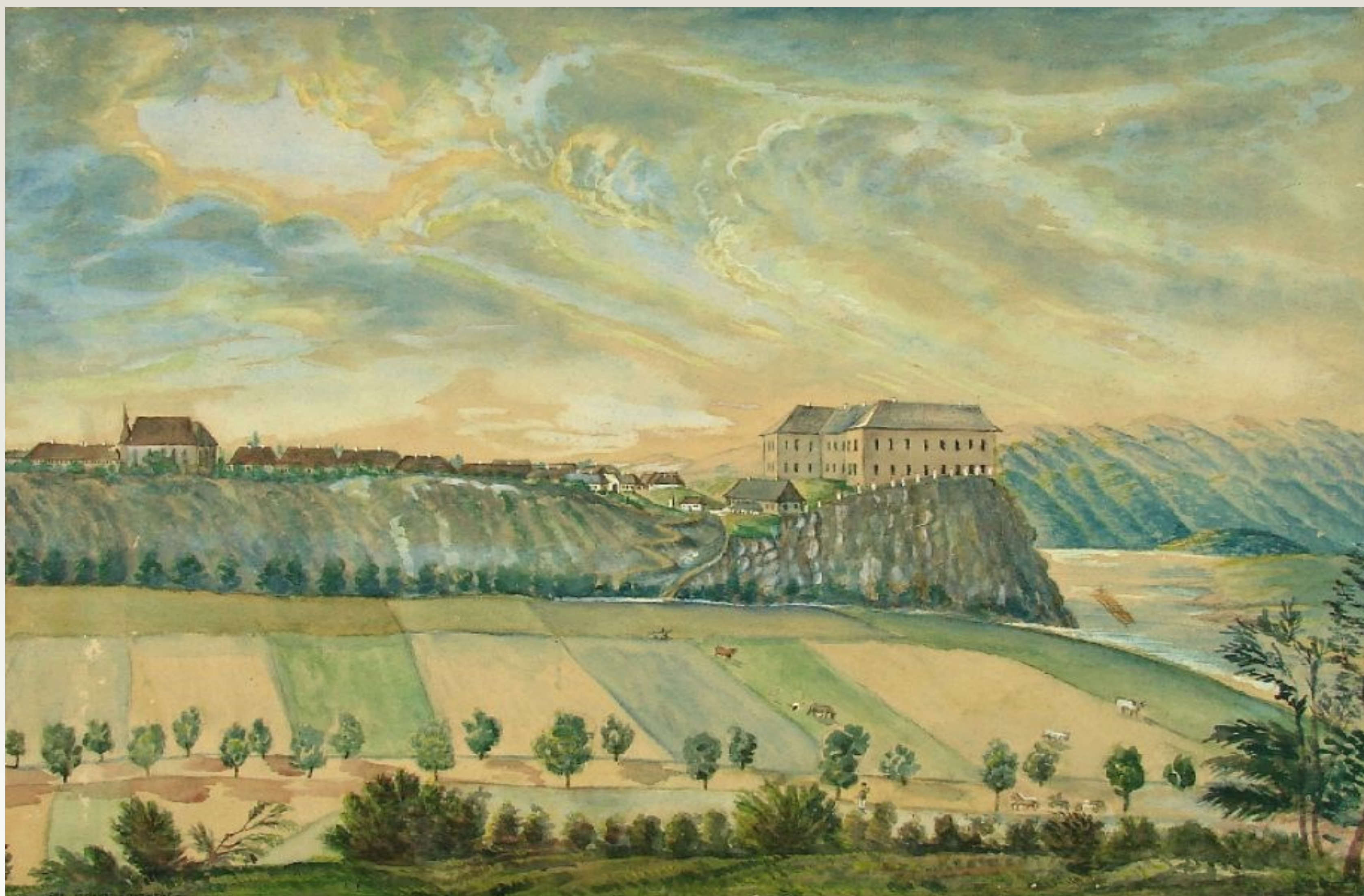
SANOK - WIDOK ZAMKU OD POŁUDNIA, EMANUEL VON KRONBACH, 1825