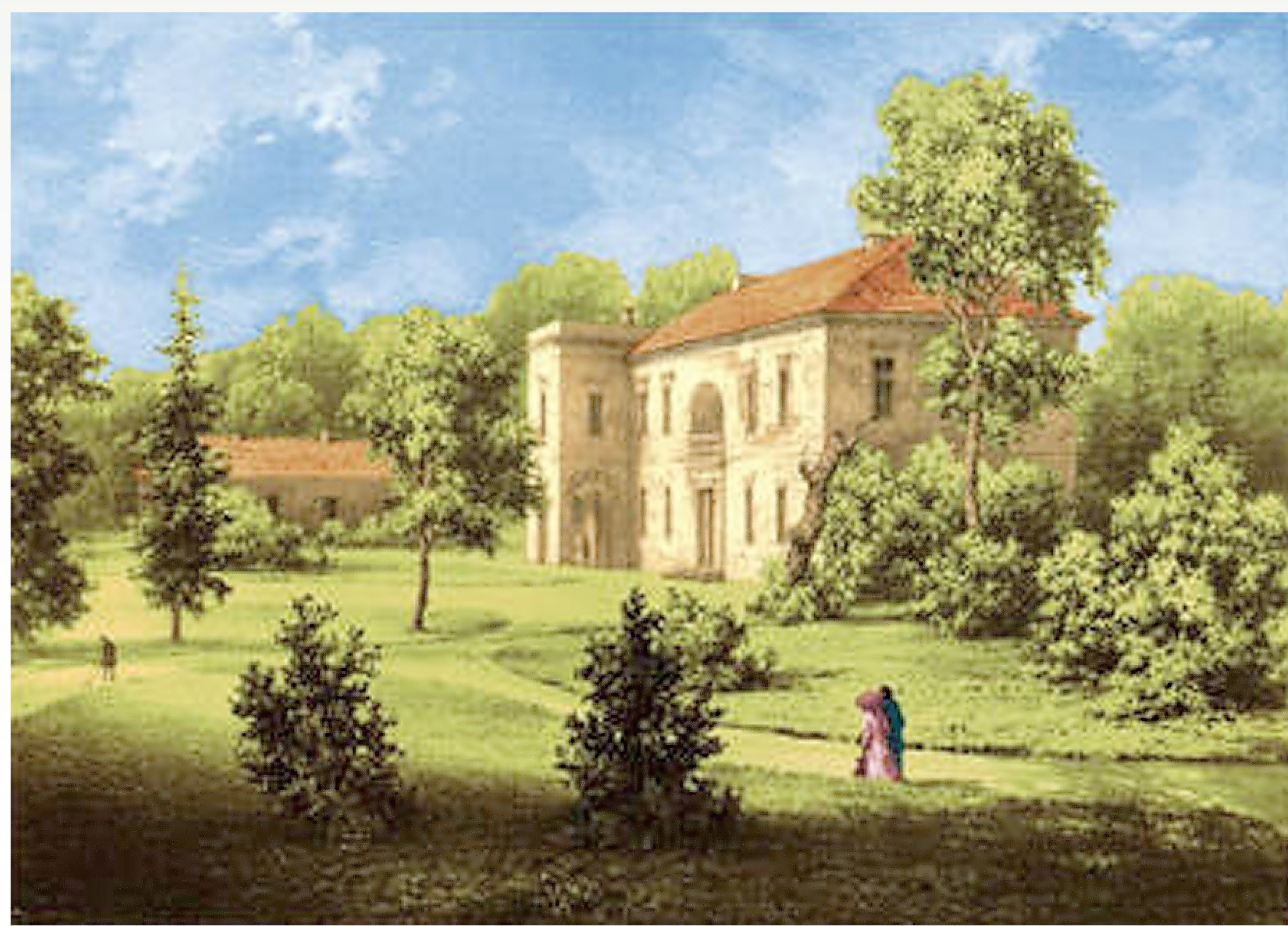
DUBIECKO NAD SANEM, NAPOLEON ORDA, 1880