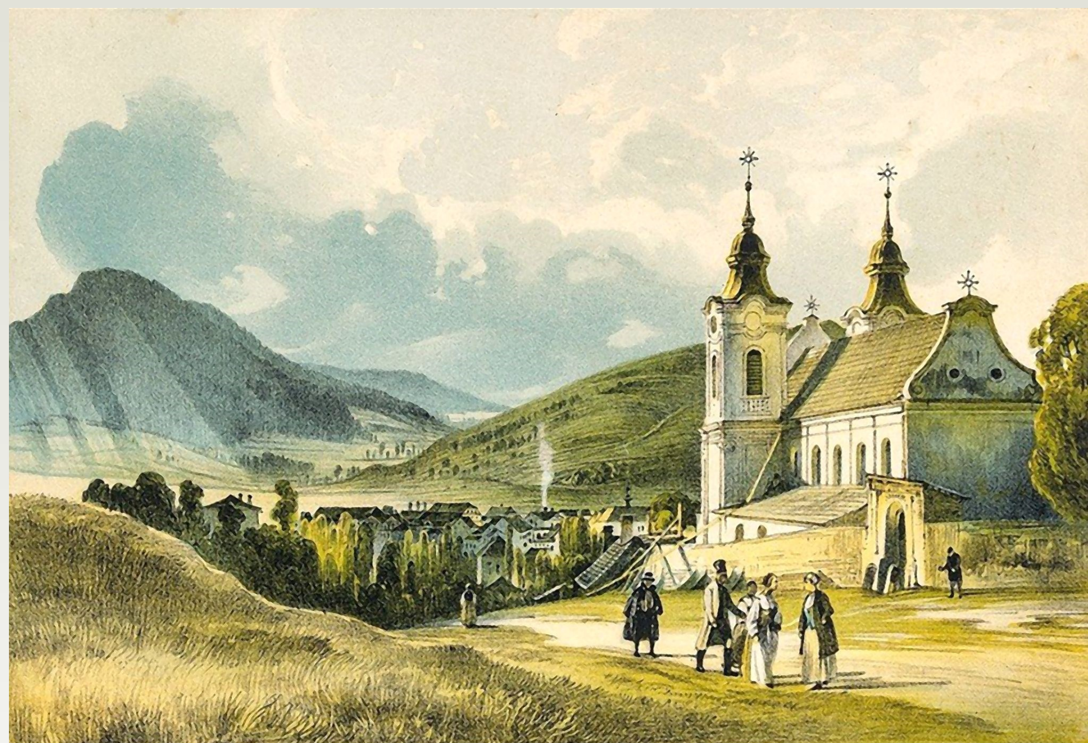
PANORAMA DUKLI, RUDOLF ALT, 1842

Wincenty Pol, Z pustyni świętego Jana w Dukli