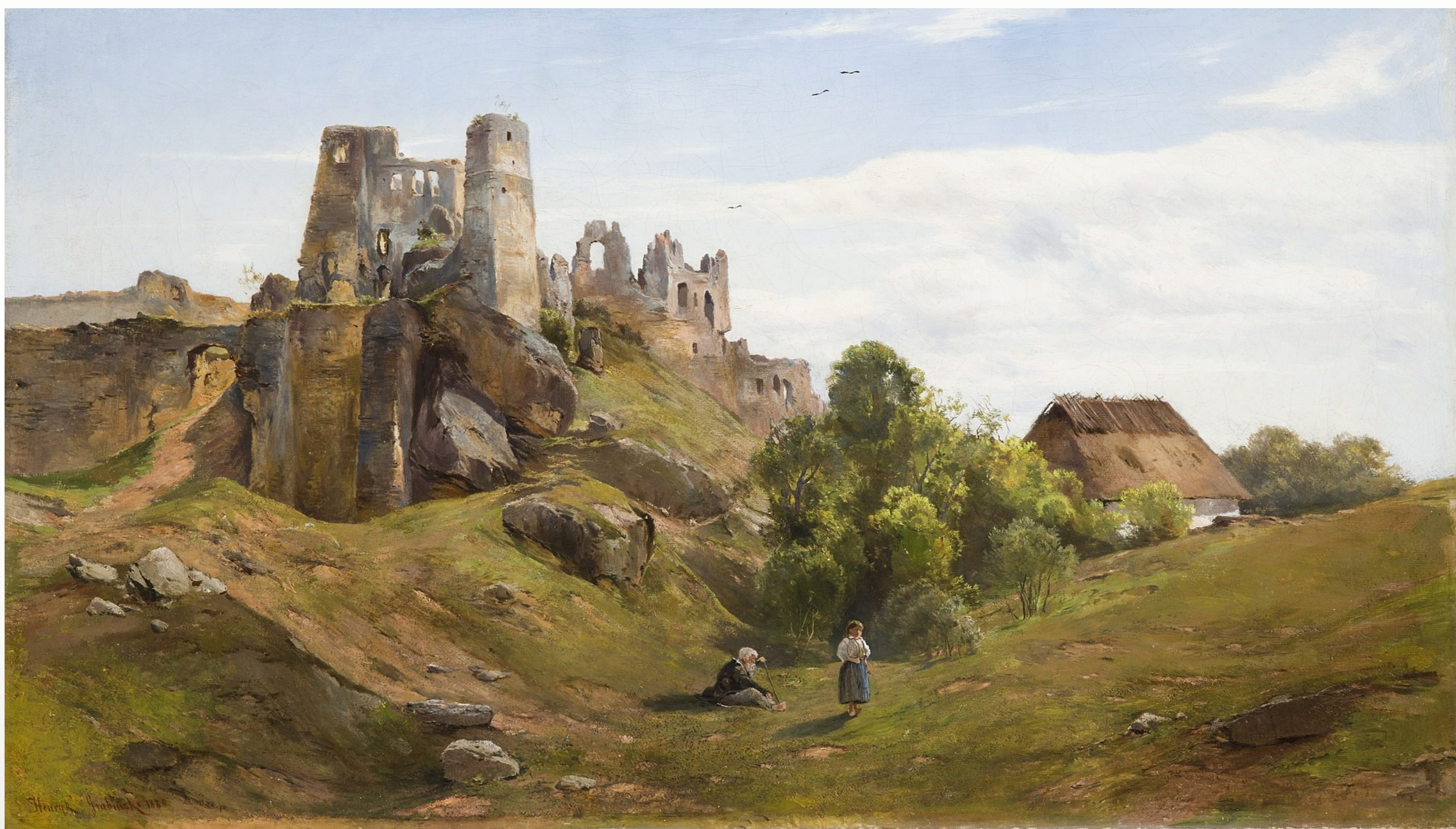
RUINY ODRZYKONIA, HENRYK GRABIŃSKI, 1880