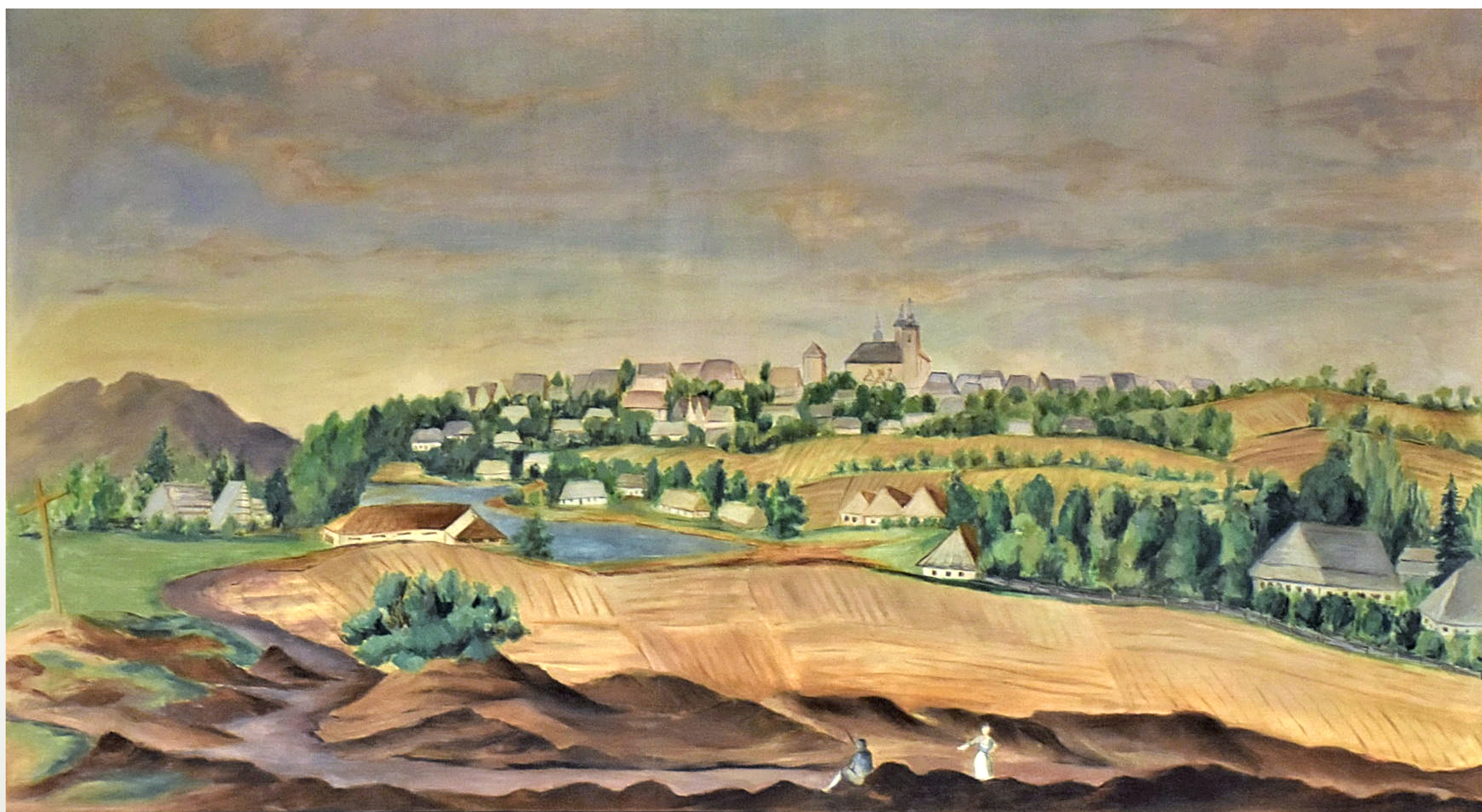
WIDOK BRZozowa, EMANUEL VON KRONBACH, XIX W.