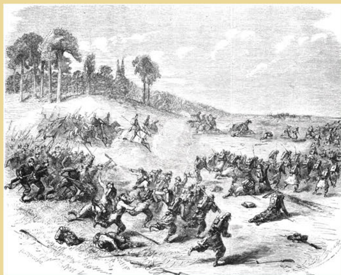
Bitwa pod Kobylanką, 1 i 6 maja 1863 r.