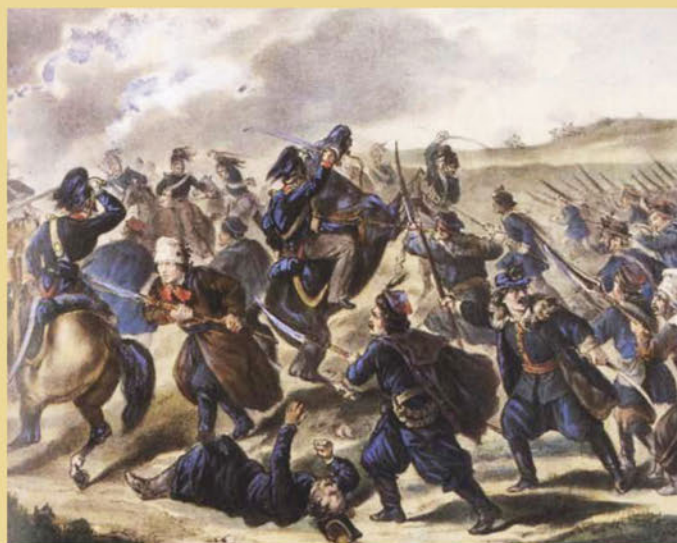
Bitwa pod Miechowem, 17 lutego 1863 r.